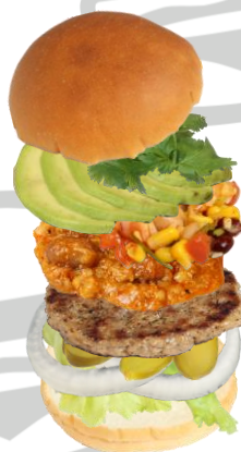
MEXICANバーガー (チリコンカン & 豆サラダ & アボカド)

Mexican Burger (Chili con Carne & Beans Salad & Avocado)