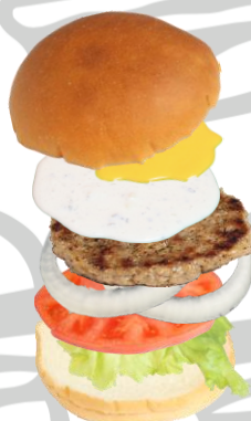
ゴルゴンゾーラバーガー (ブルーチーズ & ハニーマスタード)

Gorgonzola Cheese Burger (Bluecheese & Honey Mustard)