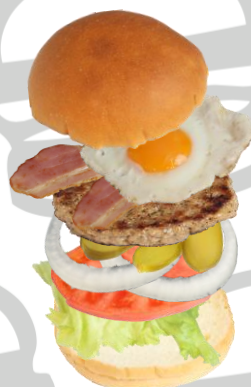
ベーコン&エッグ バーガー