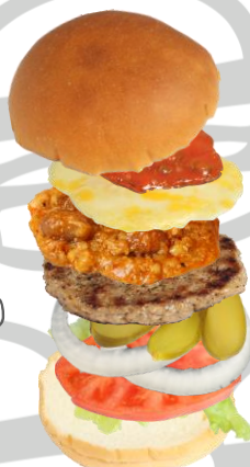
チリ & チーズバーガー (チリコンカン & MELT チーズ)

Chili & Cheese Burger (Chili con Carne & Melt Cheese)