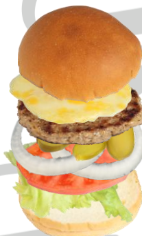
MELTチーズバーガー Cheese Burger