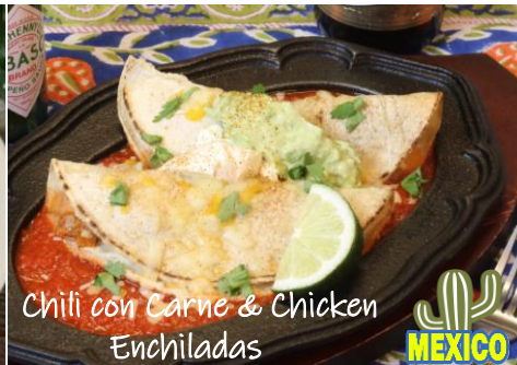
Chili con Carne & Chicken Enchiladas