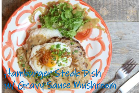
Hamburger Steak Dish w/ Gravy Sauce Mushroom