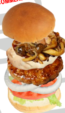
TERIYAKI バーガー (テリヤキパティ & キノコソース & タルタルソース)

Teriyaki Hamburger (Patty w/ Teriyaki Sauce & Mushrooms & Tartar Sauce)