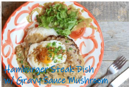
Hamburger Steak Dish w/ Gravy Sauce Mushroom