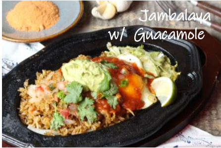
Jambalaya w/ Guacamole