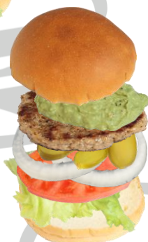
ワカモーレバーガー Guacamole Burger