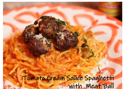
Tomato Cream Sauce Spaghetti with Meat Ball

サーモンとシラスの大葉ペペロンチーノ 1,130 Green Shiso Leaf Peperoncino Spaghetti with Salmon & Whitebait