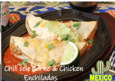
Chili con Carne & Chicken Enchiladas