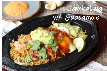
Jambalaya w/ Guacamole